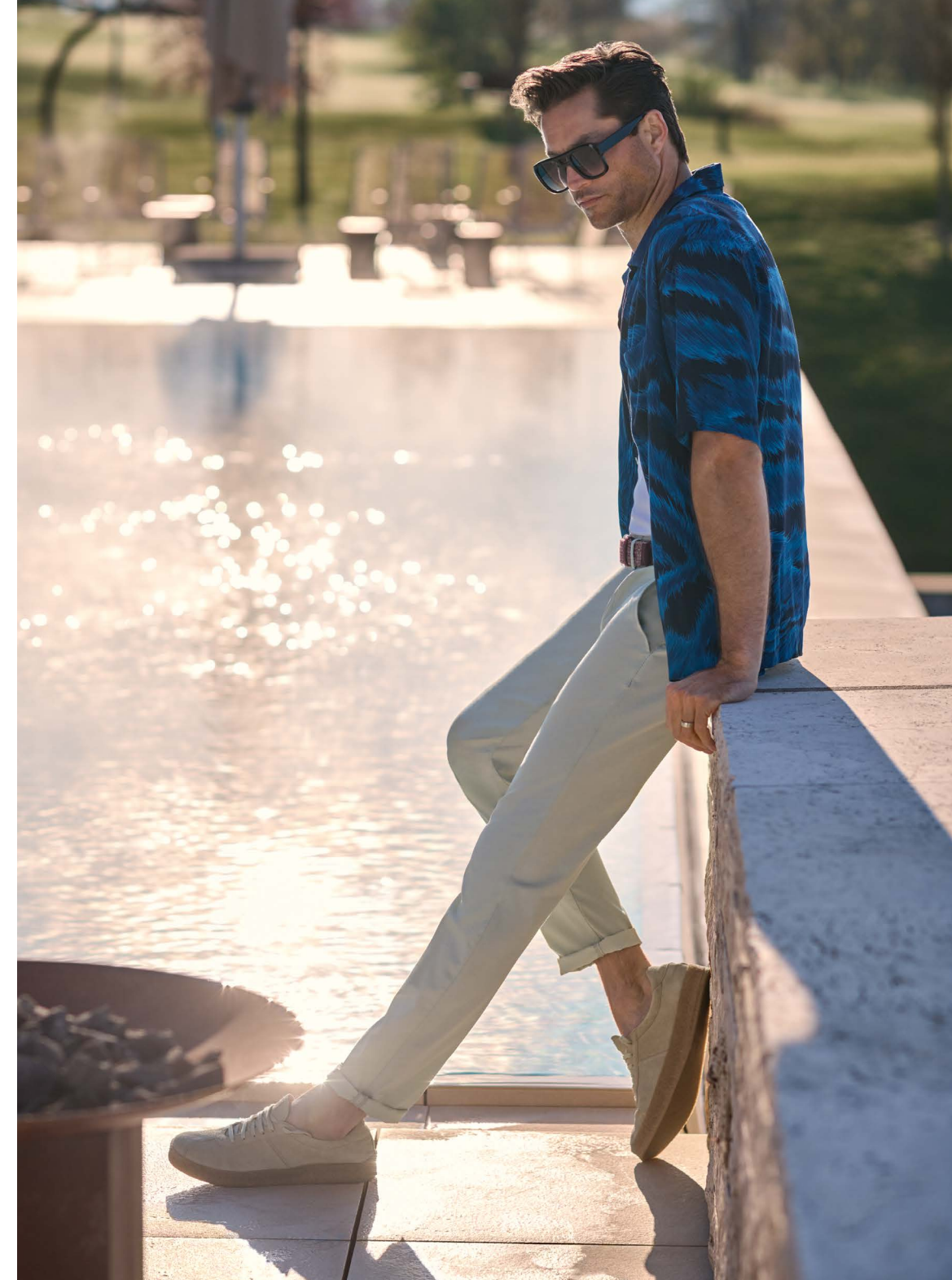
1506 LOU-J-GU, Light Cotton

Um auch bei hochsommerlichen Temperaturen stets lässig und gut gekleidet durch den Tag zu kommen, sind konkrete modische Interventionen erfahrungsgemäß unumgänglich. Gut, dass ALBERTO die passenden Antworten auf die Frage nach der richtigen Hosenwahl parat hat. Zur Sommersaison 2026 präsentieren die Mönchengladbacher eine sowohl stilistisch als auch materialtechnisch facettenreich inszenierte Serie an Bermudas und Slacks, die gefühlte mit optischer Leichtigkeit verbindet – topmodern, hochfunktional, megabequem, betont sportlich und wie immer mit viel Liebe zum Detail umgesetzt. Einfach reinschlüpfen und sich wohlfühlen, ganz gleich wie hoch das Thermometer klettert!