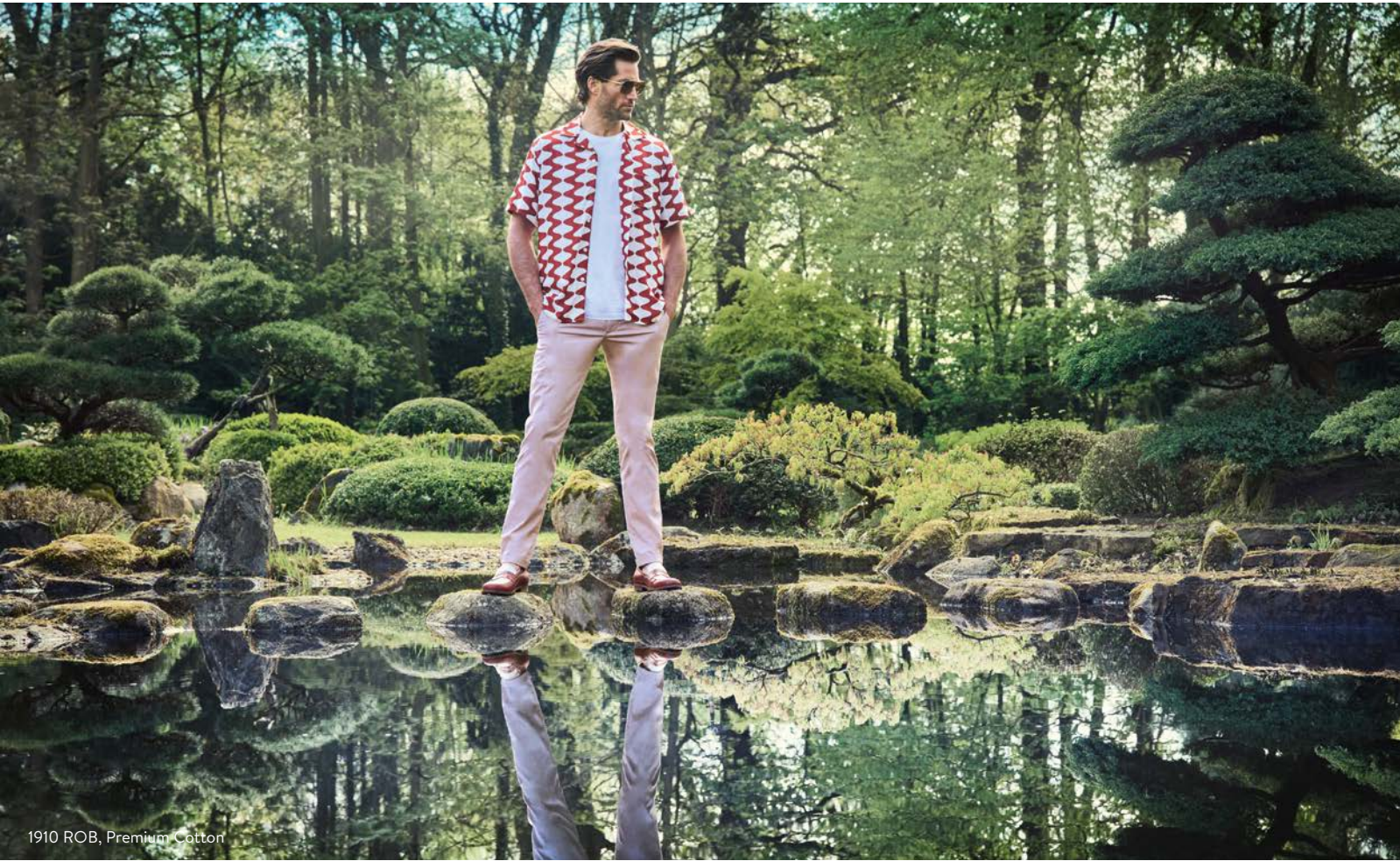
1910 ROB, Premium Cotton