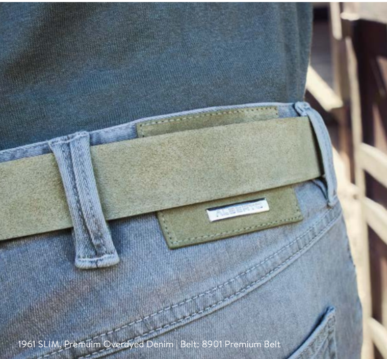
1961 SLIM, Premium Overdyed Denim | Belt: 8901 Premium Belt