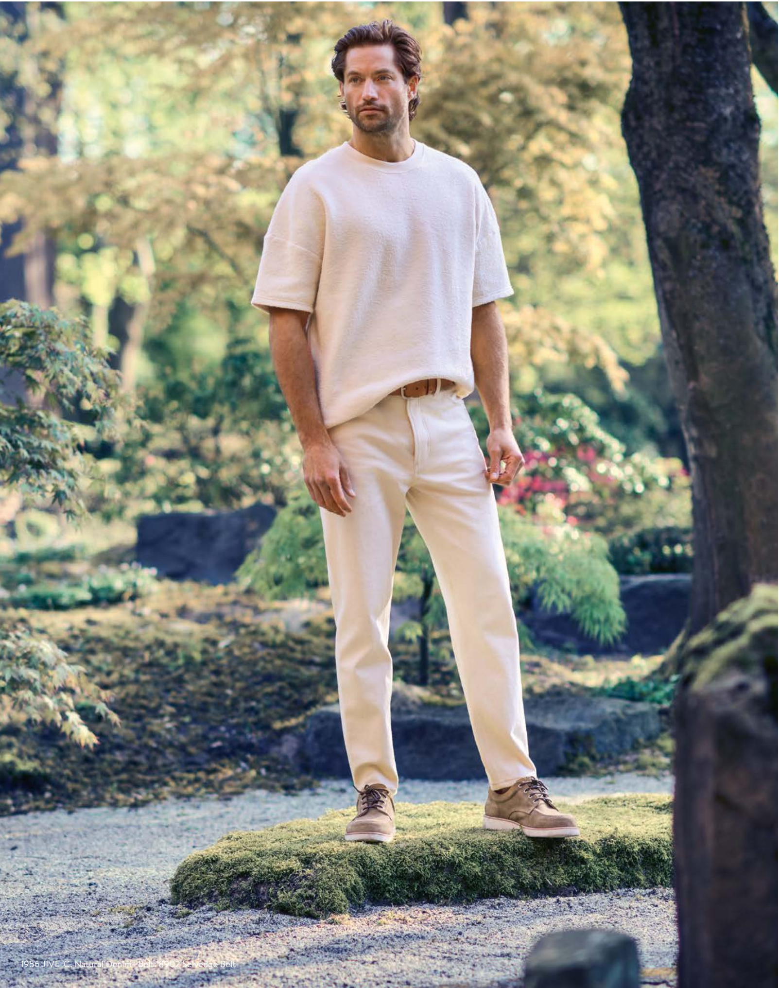
1956 JIVE-C, Natural Denim | Belt: 8902 Selvedge Belt

Wir legen uns fest und küren unsere Natural Denims zu den Must-haves des Sommers 2024. Warum? Ganz einfach: Sowohl in der Rigid- als auch in der Stretch-Variante bestechen die ungefärbten und nur kurz gewaschenen Jeans mit einer Natürlichkeit und authentischen Charakterstärke, die ihresgleichen sucht. Besonders als stylische ‚Jive-C‘, einer cropped Jeans in Cotton-/Stretch-Variante entfalten die Denims ihr ganzes Können. Als Add-on empfehlen wir unseren ungefärbten Gürtel aus robustem und dennoch angenehm weichem italienischem Rindsleder.