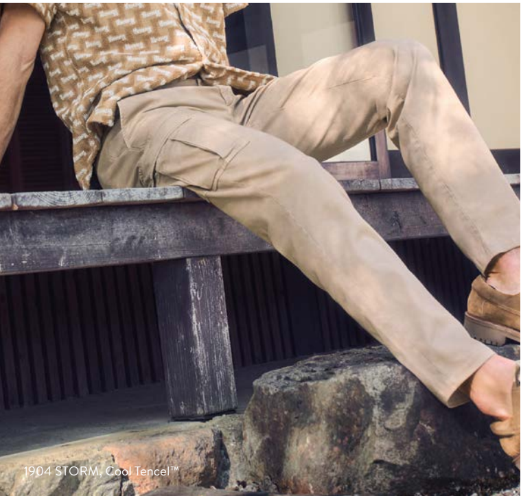
1904 STORM, Cool Tencel™