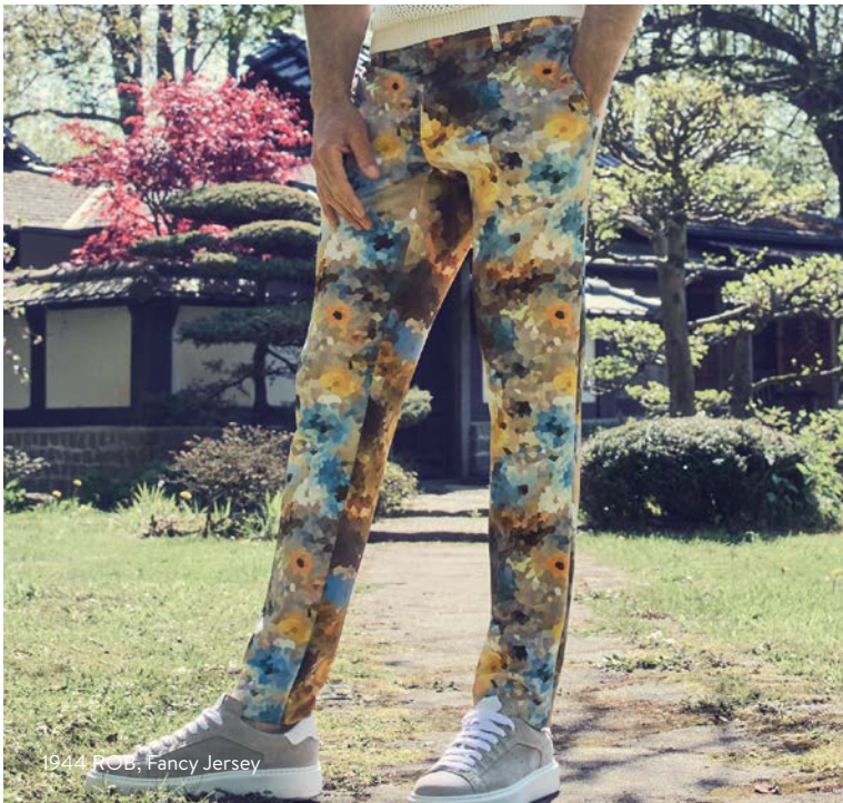
1944 ROB, Fancy Jersey