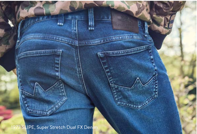
1973 SLIPE, Super Stretch Dual FX Denim