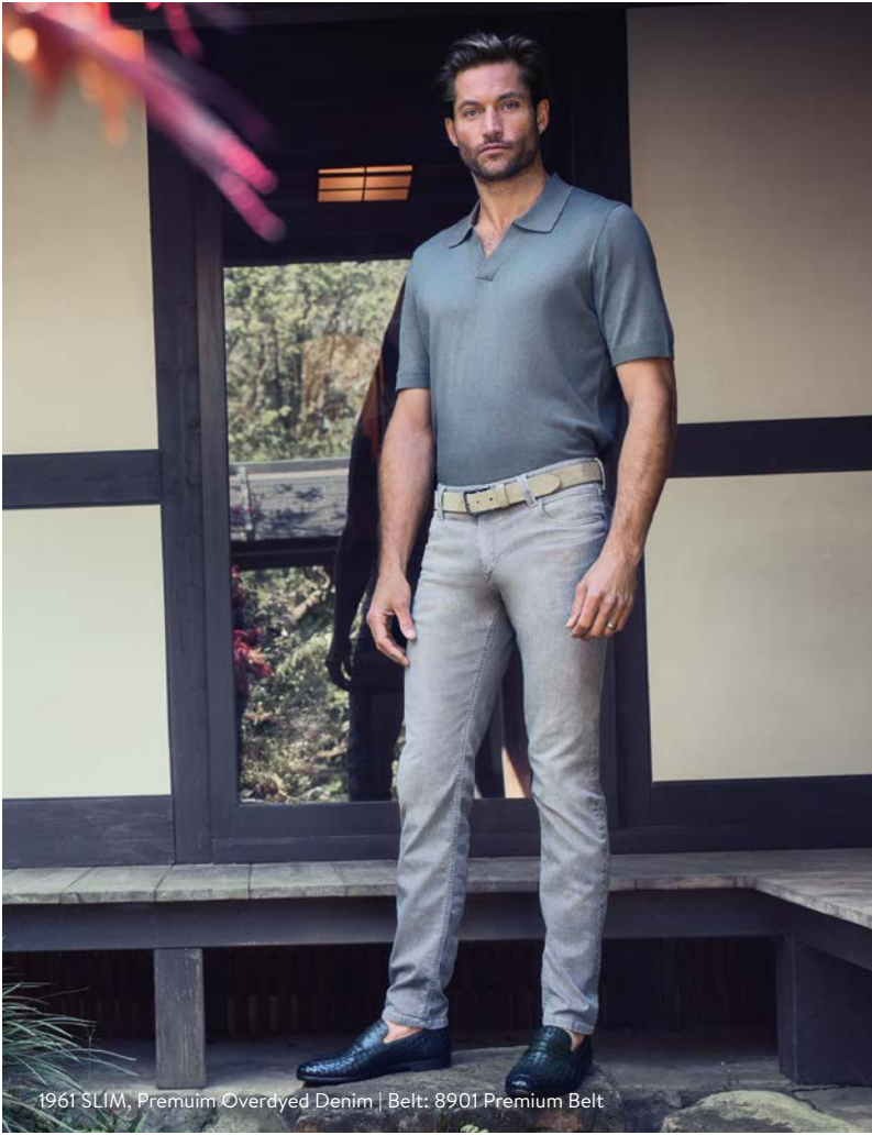
1961 SLIM, Premium Overdyed Denim | Belt: 8901 Premium Belt