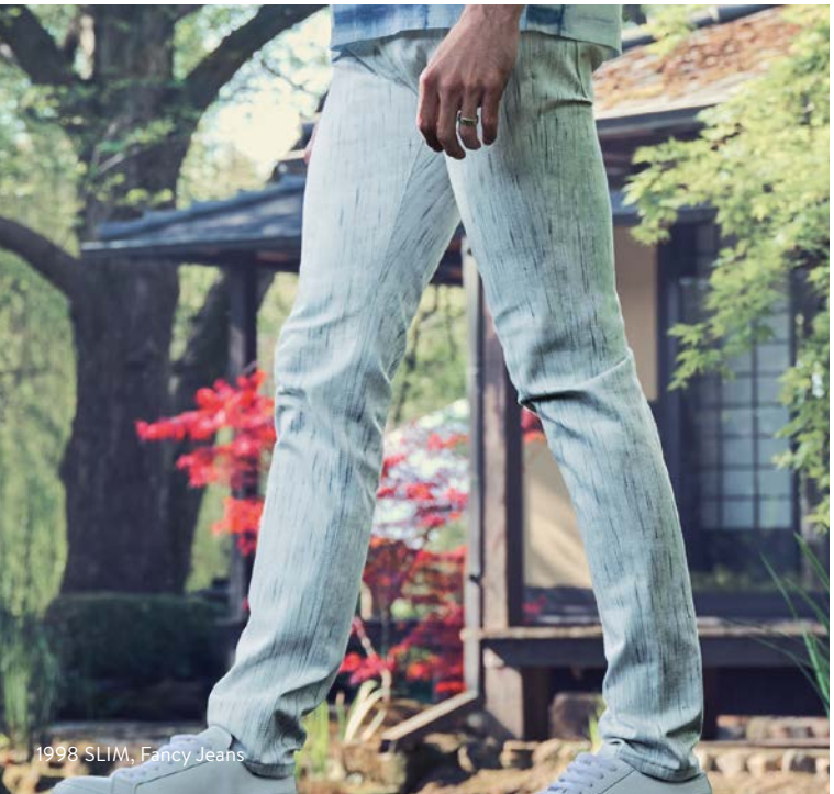
1998 SLIM, Fancy Jeans