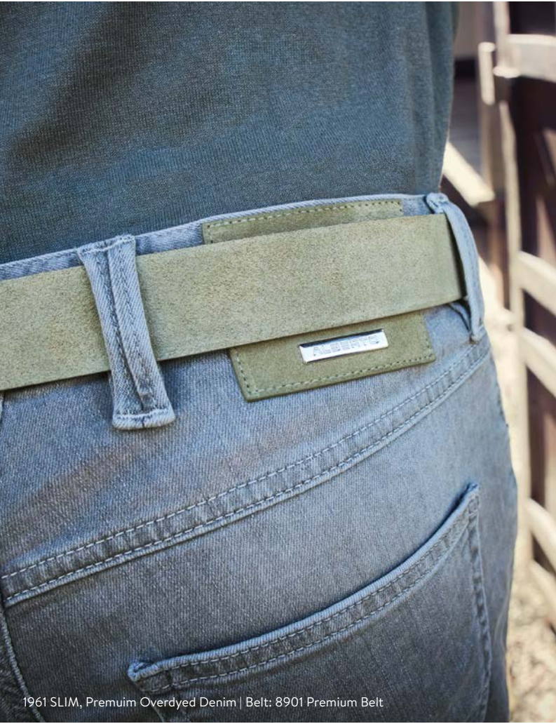
1961 SLIM, Premium Overdyed Denim | Belt: 8901 Premium Belt