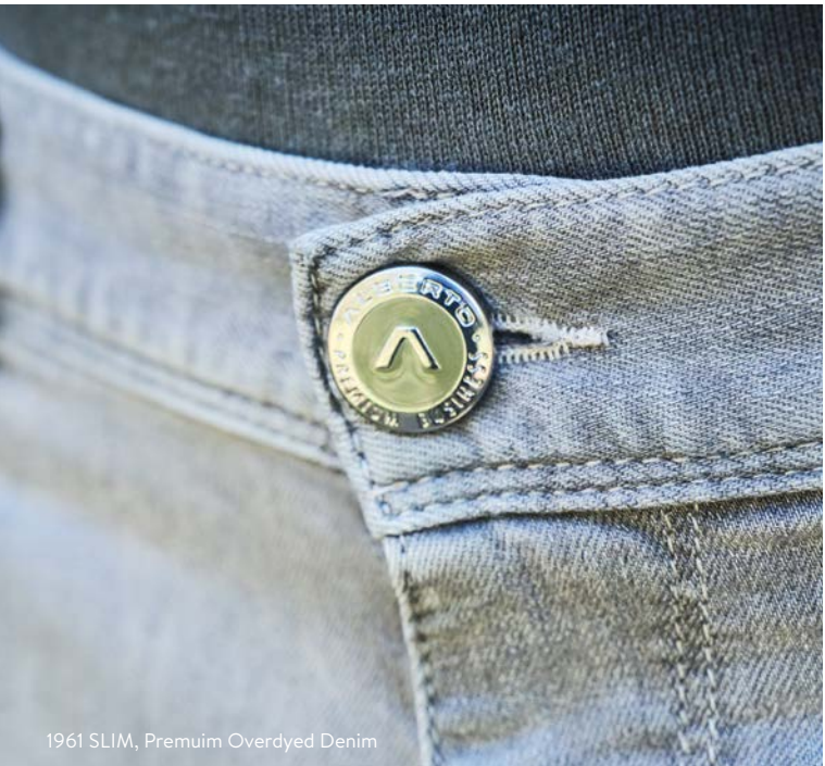
1961 SLIM, Premium Overdyed Denim