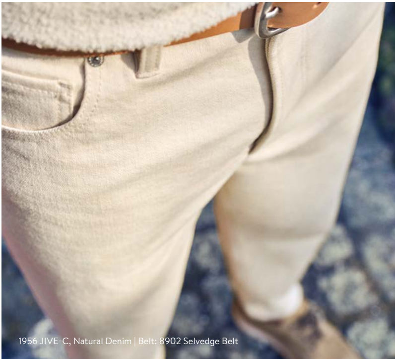
1956 JIVE-C, Natural Denim | Belt: 8902 Selvedge Belt