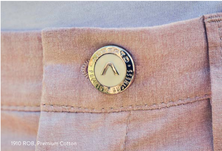
1910 ROB, Premium Cotton