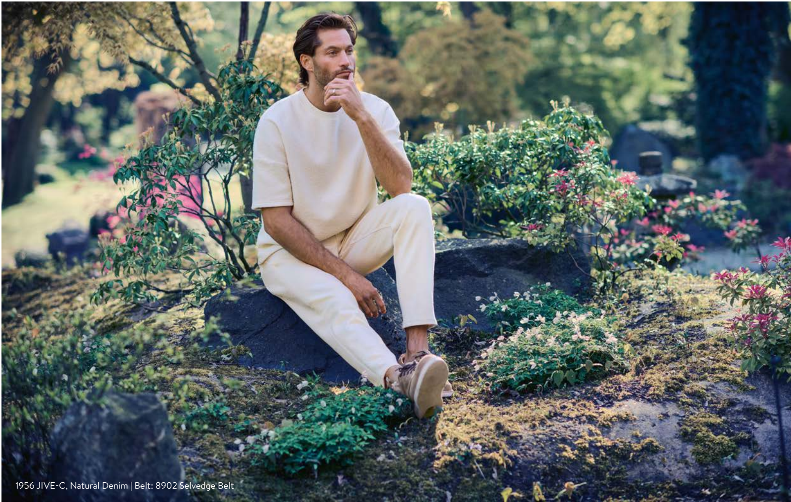
1956 JIVE-C, Natural Denim | Belt: 8902 Selvedge Belt