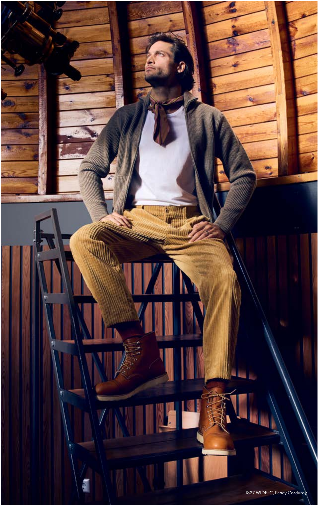
1827 WIDE-C, Fancy Corduroy

Es ist die Kombination aus edler Optik und wunderbar weichem Griff, der Corduroy den Ruf eines königlichen Stoffes zu verdanken hat. Ein echtes Highlight des Programms ist allerdings die No Cotton Corduroy. Gefertigt aus italienischer Ware kommen die komplett baumwollfreien Hosen als Tunnelzugvariante sowie als High Waist, Cropped Length-Newcomer. Abgerundet wird das Segment mit der Fancy Velvet, einer samtigen 5-Pocket in Schwarz, Blau, Taupe und Military. Gleich um weitere vier Artikel baut ALBERTO das Cord-Programm für die Wintersaison 2023 aus: Betont schmale Rippen und ein extravagantes Detailing sorgen bei der ALBERTO Babycord für einen besonders feinen Look, der mit einer Farbrange zwischen Off-White, Schilf, Grau, Military und Rauchblau noch unterstrichen wird. Aufgemacht sind die Pants als Chino sowie brandneu als Slim-Fit Cargo und High Waist Tapered-Fit. Betont lässig und dennoch ausnehmend elegant: die Smart Corduroy als Tapered-Fit Slack Form und Tunnelzughose.