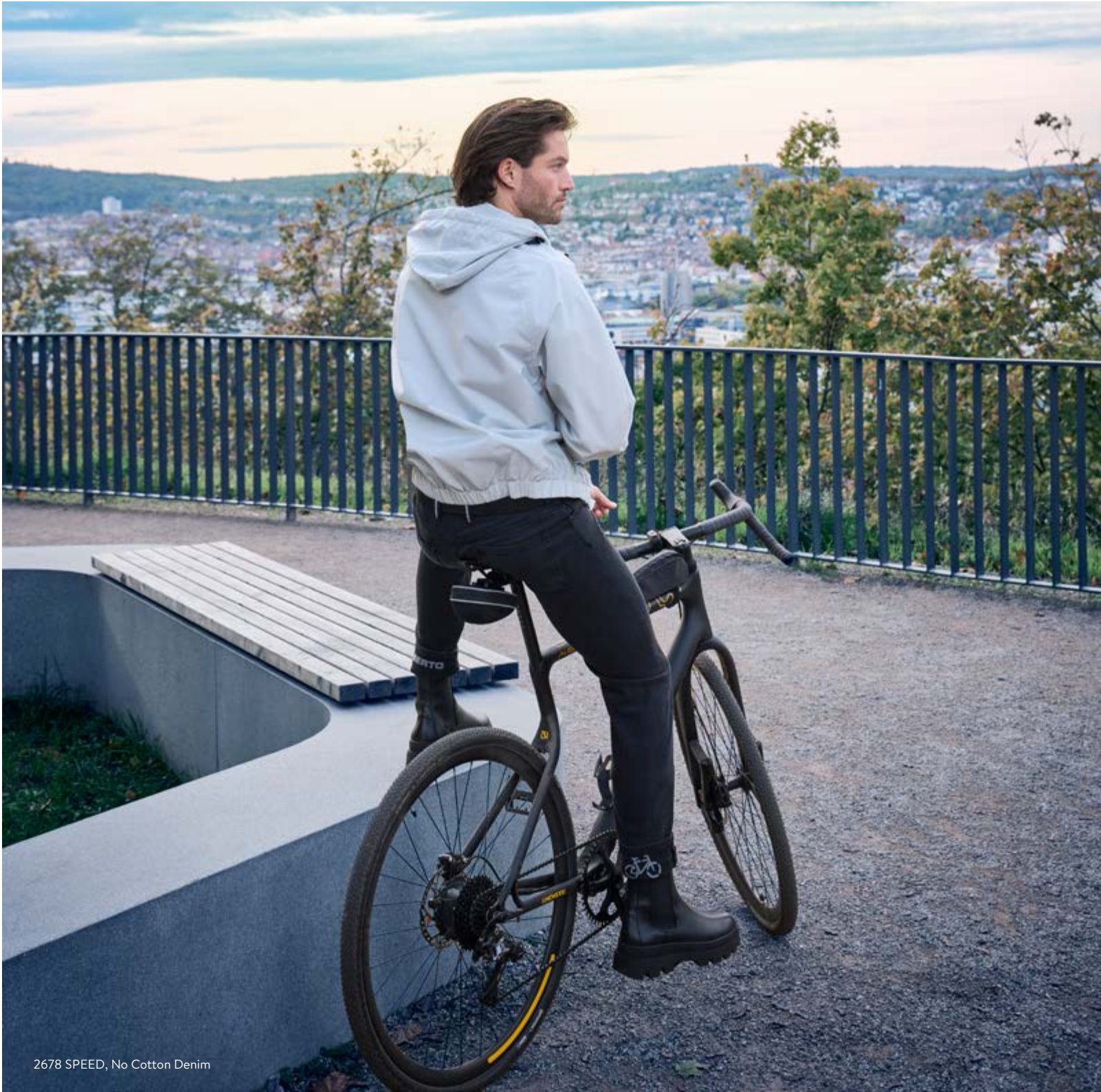
2678 SPEED, No Cotton Denim