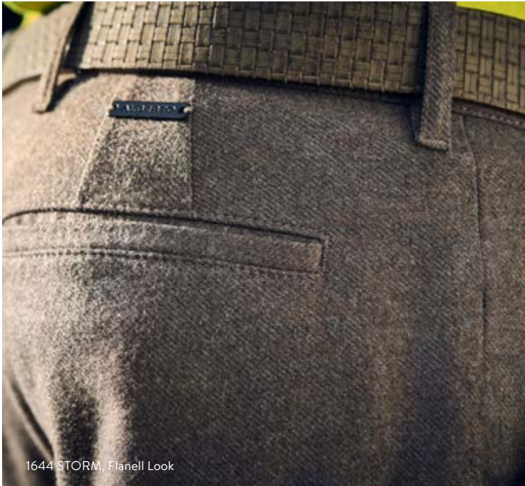
1644 STORM, Flanell Look