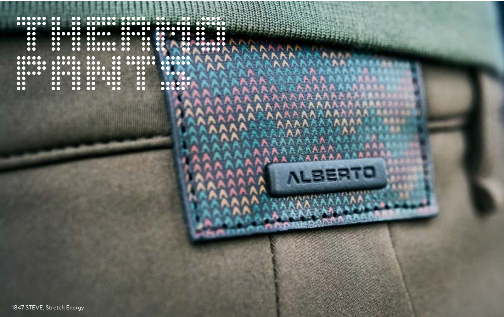
1847 STEVE, Stretch Energy