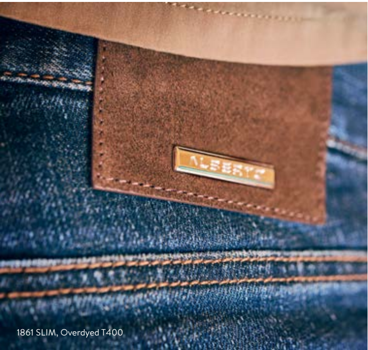
1861 SLIM, Overdyed T400