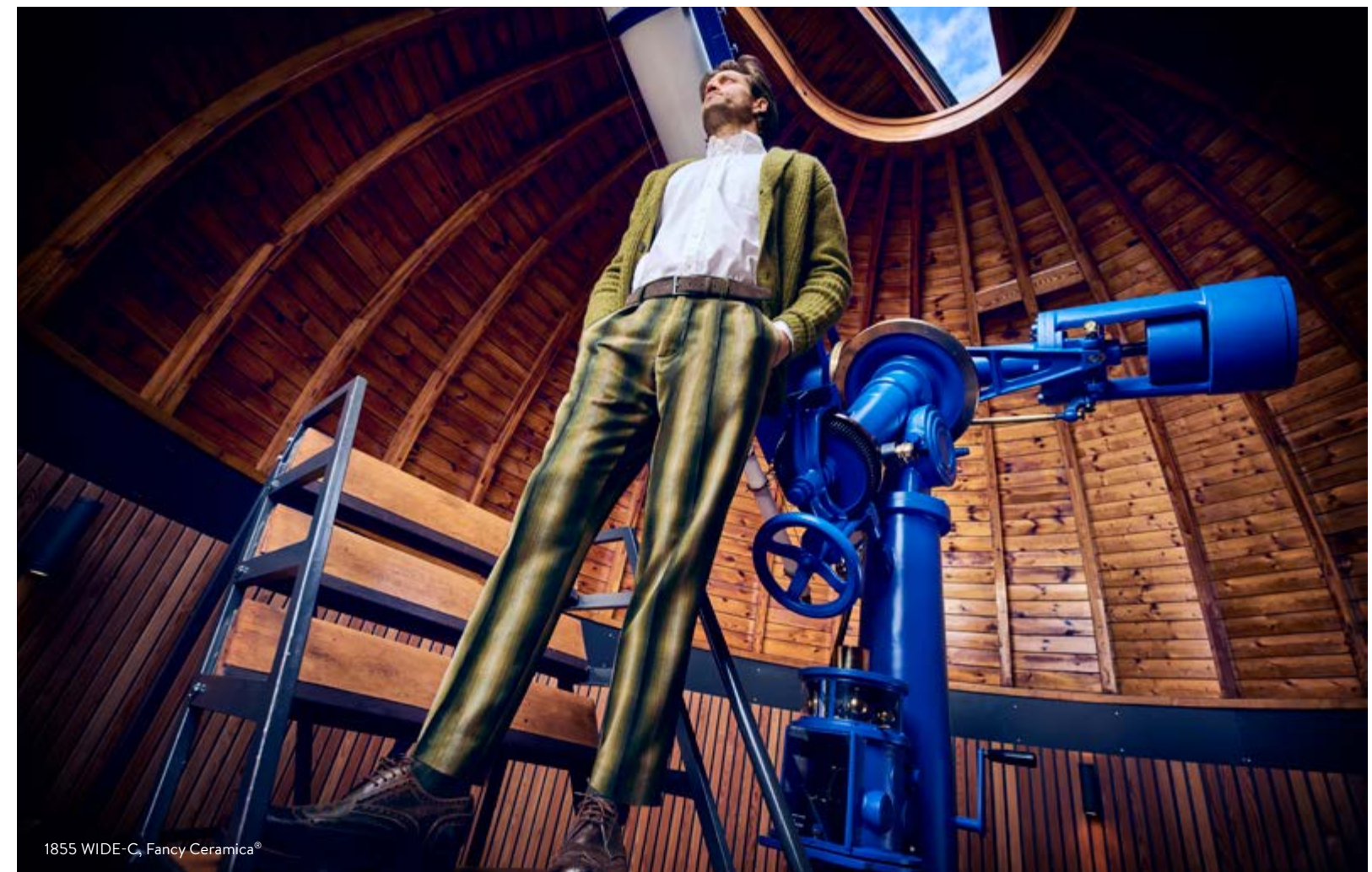
1855 WIDE-C, Fancy Ceramica®