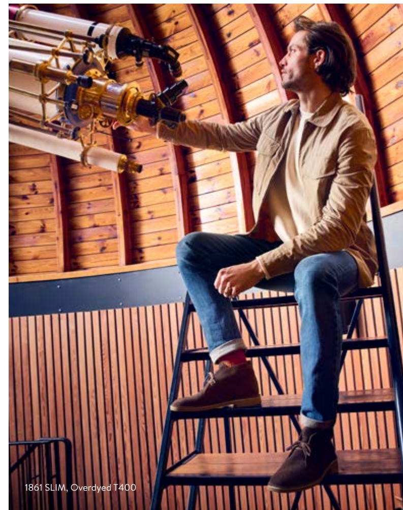
1861 SLIM, Overdyed T400