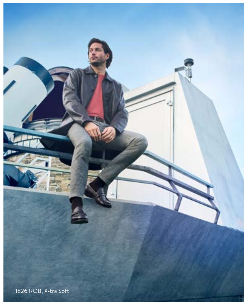
1826 ROB, X-tra Soft