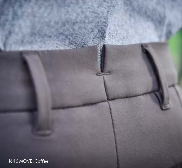
1646 MOVE, Coffee