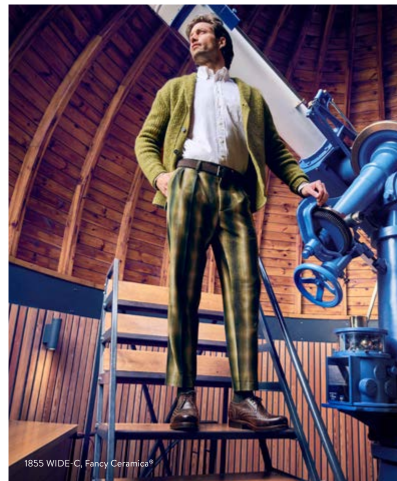
1855 WIDE-C, Fancy Ceramica®