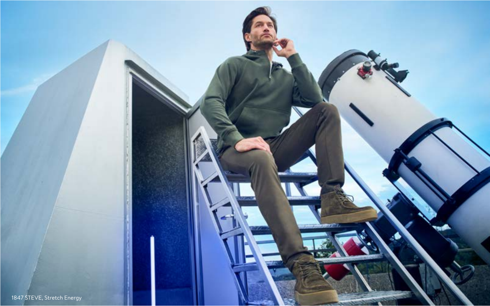
1847 STEVE, Stretch Energy