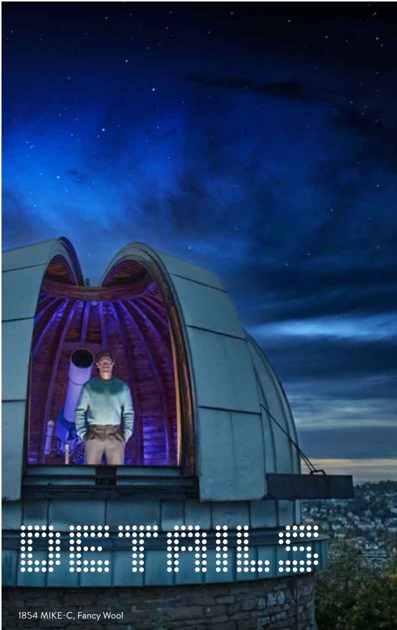
1854 MIKE-C, Fancy Wool