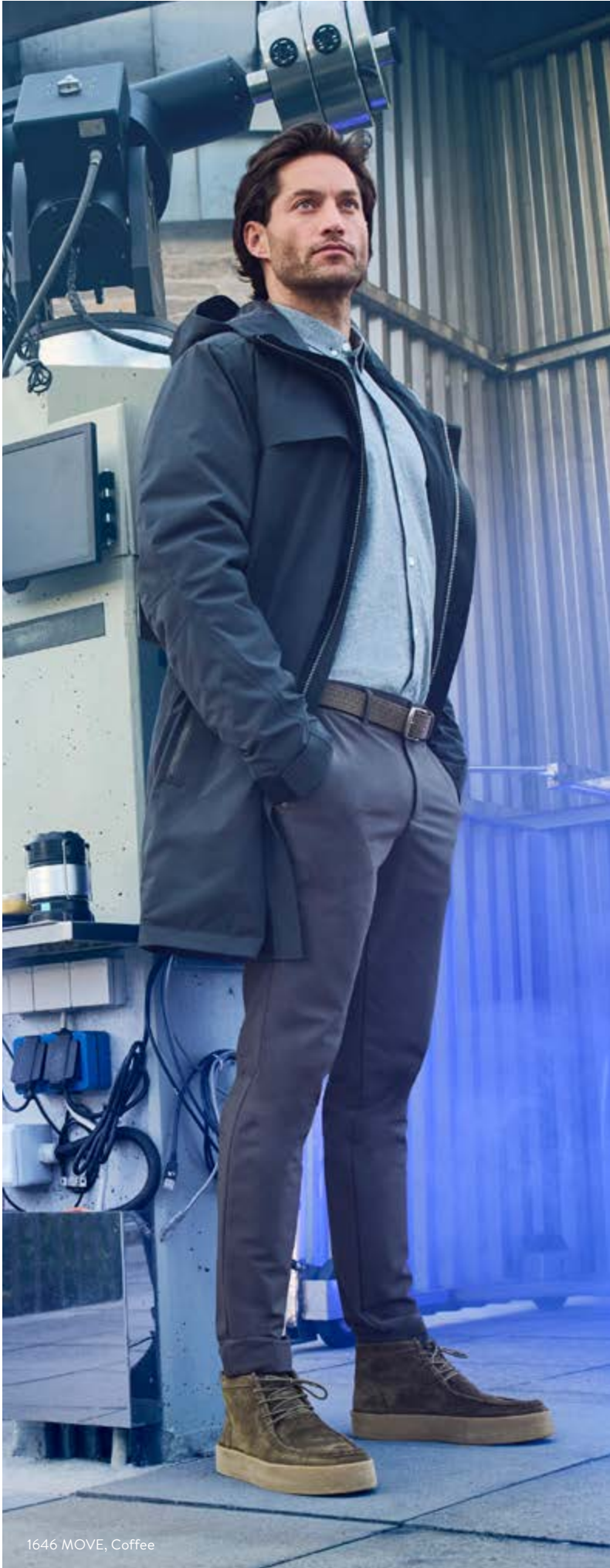
1646 MOVE, Coffee

Je kälter der Winter, desto wärmer sollten die Hosen halten. Unser neues, hochfunktionales Thermo Pants-Programm sorgt nicht nur bei frostigen Temperaturen für wohligen Tragekomfort, sondern hat auch sonst einiges zu bieten. Gearbeitet aus bi-elastischen Made in Japan-Stoffqualitäten punktet die Stretch Energy mit wärmender angerauter Innenseite für perfekte Muskeldurchblutung und guten Energiefluss. Eine wasserabweisende Oberfläche und eine smarte Stilistik sind dabei natürlich absolute Ehrensache. Zum Launch kommt die Stretch Energy als ‚Steve‘ und ‚Robin‘ in Bordeaux, Braun, Military, Navy und Schwarz. Ein echtes Highlight ist die aus italienischer Ware gefertigte ‚Coffee‘. Die aus technischem Performance-Gewebe mit in die Fasern eingearbeiteter Kaffee Kohle gefertigten Pants mit dem weichen Griff sind nicht nur wasserabweisend und halten die Körpertemperatur, sie trocknen auch schnell und überzeugen mit einem äußerst stilbewussten Look. Erhältlich sind die cleveren Warmhalter in Elephant, Royal, Navy, Grey und Schwarz als modische Tunnelzughose sowie als Tapered-Fit-Newcomer ‚Bart‘ und ‚Move‘.