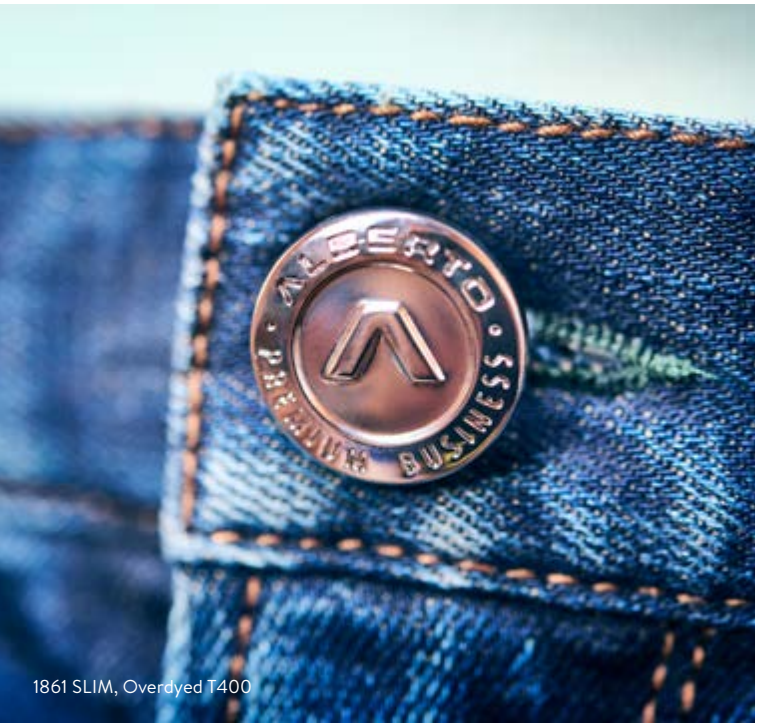
1861 SLIM, Overdyed T400