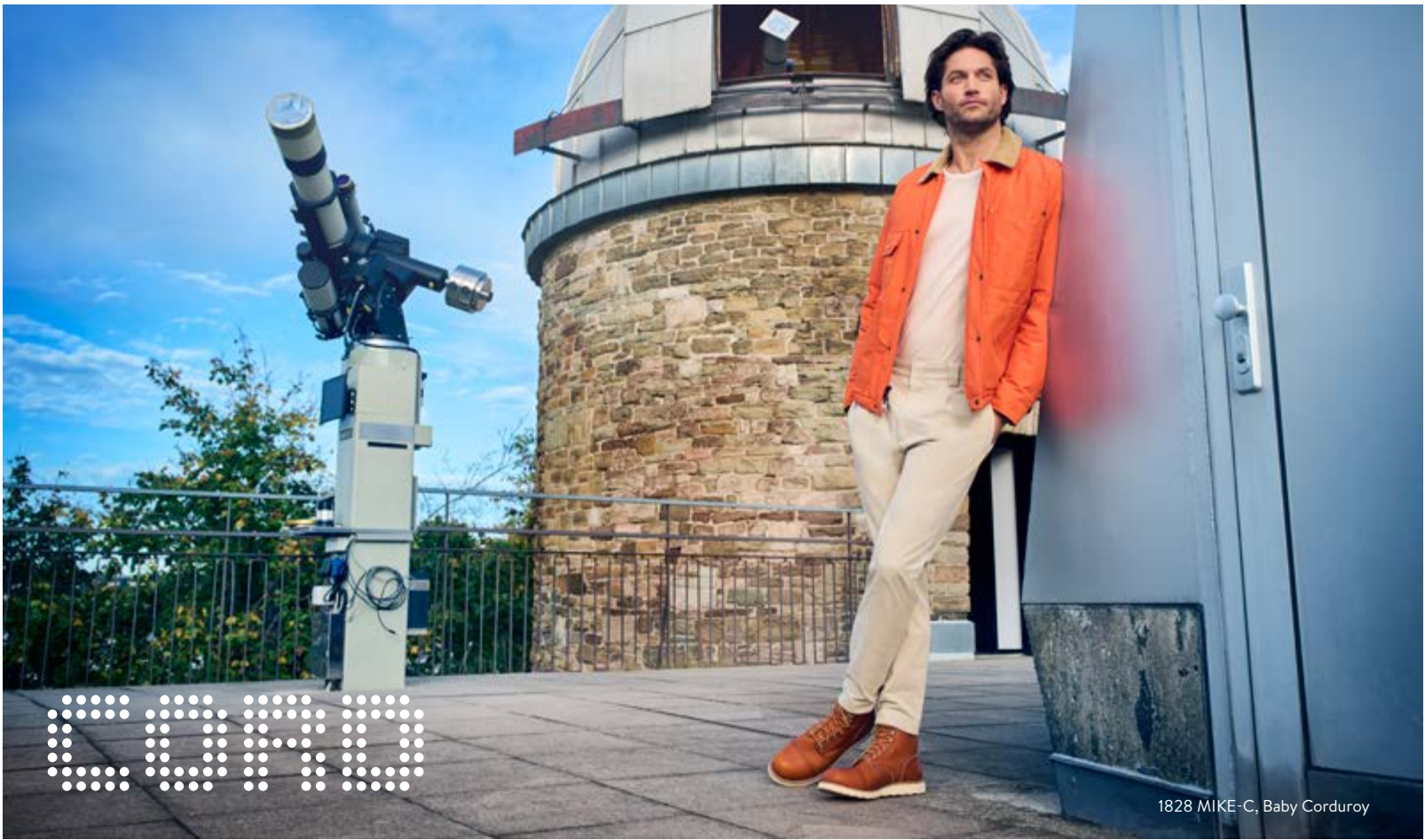
1828 MIKE-C, Baby Corduroy