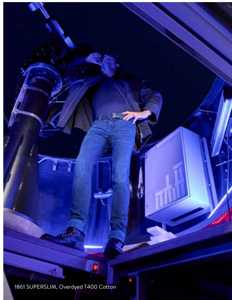
1861 SUPERSLIM, Overdyed T400 Cotton

Bei den Premium Denims setzt ALBERTO zur Wintersaison 2023 ganz auf authentische Vintage-Waschungen. Neben Slims und Superslims gehen hier auch ein Tapered-Fit und ein Regular-Fit an den Start. Die in diversen grauen und blauen Waschungen erhältlichen Premium Tencel Denims überzeugen einmal mehr mit raffinierten Destroys und Repair-Elementen sowie der exklusiven Premiumausstattung mit wertvollen Knöpfen, Labels, Innenfuttern und der Safe Pocket.