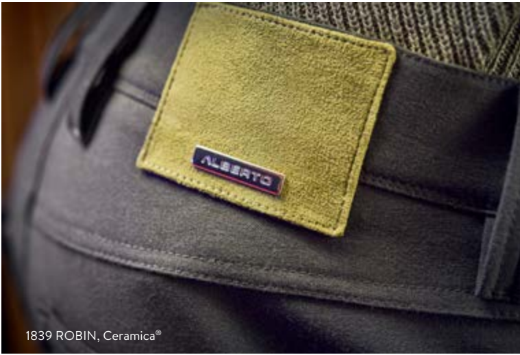
1839 ROBIN, Ceramica®