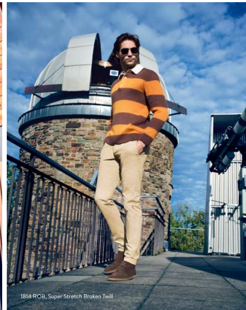
1814 ROB, Super Stretch Broken Twill