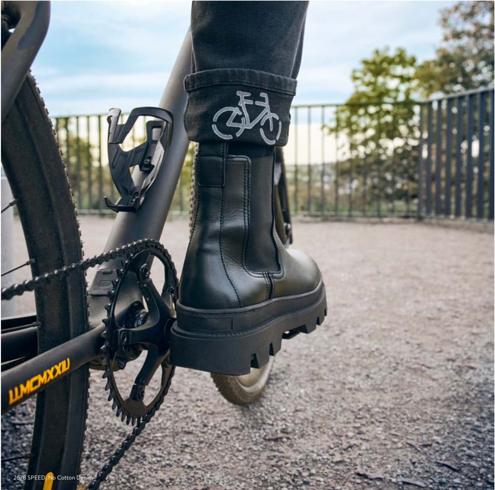
2678 SPEED, No Cotton Denim