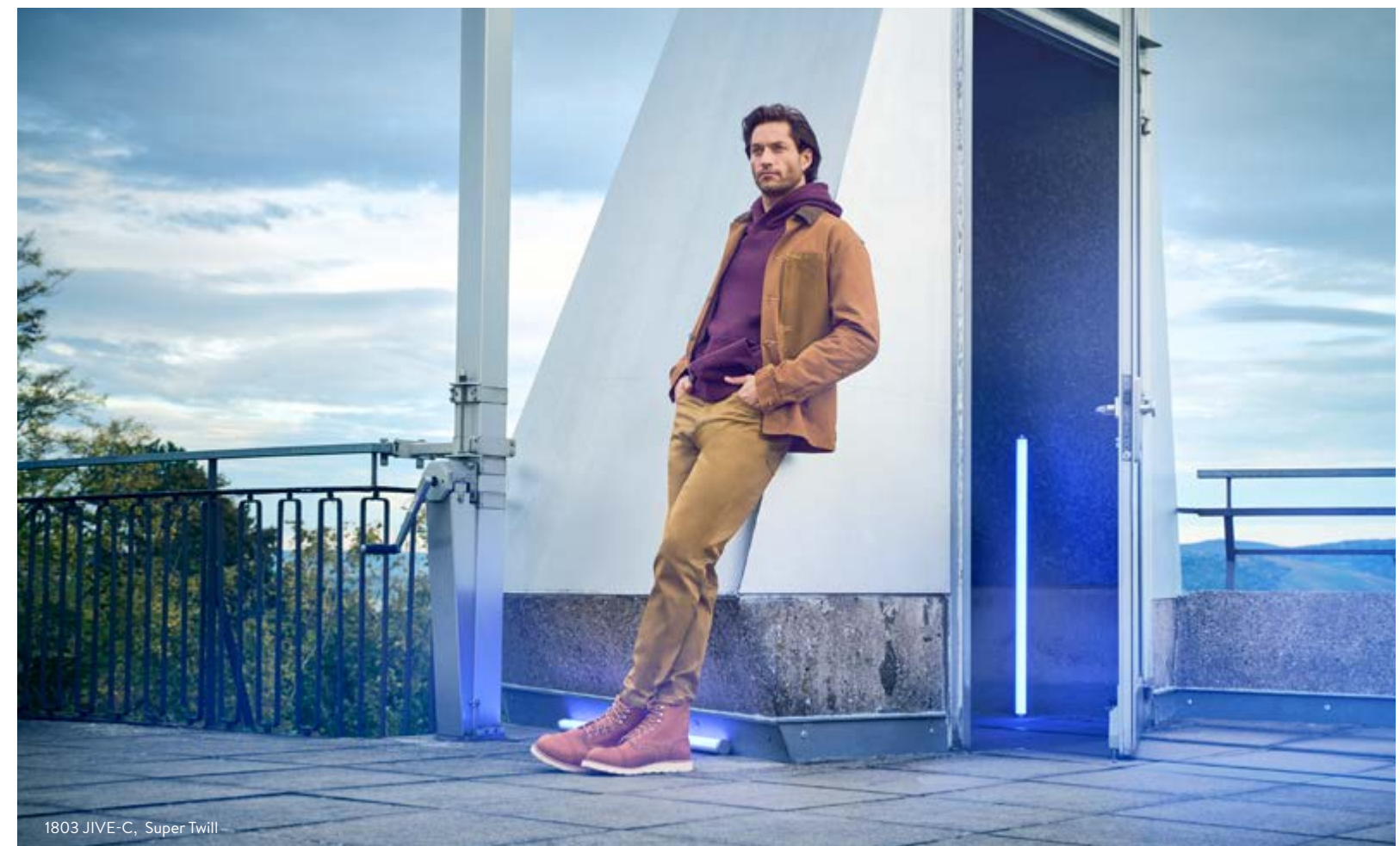
1803 JIVE-C, Super Twill