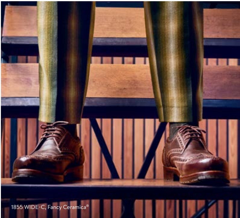
1855 WIDE-C, Fancy Ceramica®