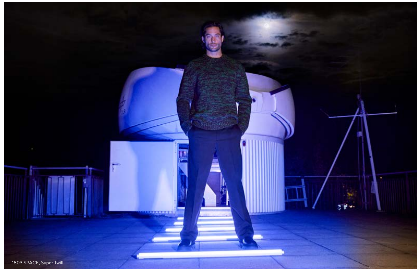
1803 SPACE, Super Twill

Bequem müssen sie sein. Dazu richtig robust und ausgestattet mit vielen praktischen Details. Geht es um wertige Produkte mit langer Lebensdauer, setzt nicht etwa die Mode, sondern der Außenseiter Arbeitsbekleidung seit Jahrzehnten die relevanten Maßstäbe. Mit den Pants unserer Neo Workwear-Serie haben wir dem Hidden Champion der Branche zur Wintersaison 2023 mit gleich drei betont weit geschnittenen Modellen ein Denkmal gesetzt. Die Non Cotton Ceramica-Chino punktet mit einem extrem weichen Griff sowie hoher Farbstabilität und ist als Neuzugang ‚Space‘, einer lässigen High Waist-Slack mit Bügelfalte, und als neuer tapered High Waist-Style ‚Mike-C‘, ebenfalls mit Bügelfalte, in Beige, Military und Blau erhältlich. Ein echtes Highlight und eine wunderbare Hommage an die Anfänge der Chino sind die aus Heavy Twill gefertigten 5-Pocket-Modelle mit Button Fly und lässiger Weite als Cropped Pants, in Beige, Military und Blau. Ziemlich smart und ganz schön fashionable: die Fancy Ceramica im toughen Karo Flanell-Look mit Bügelfalte als brandneuer High Waist Comfort-Fit.