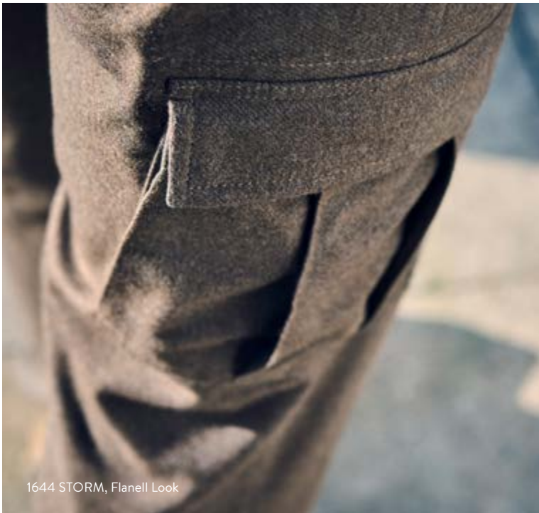
1644 STORM, Flanell Look