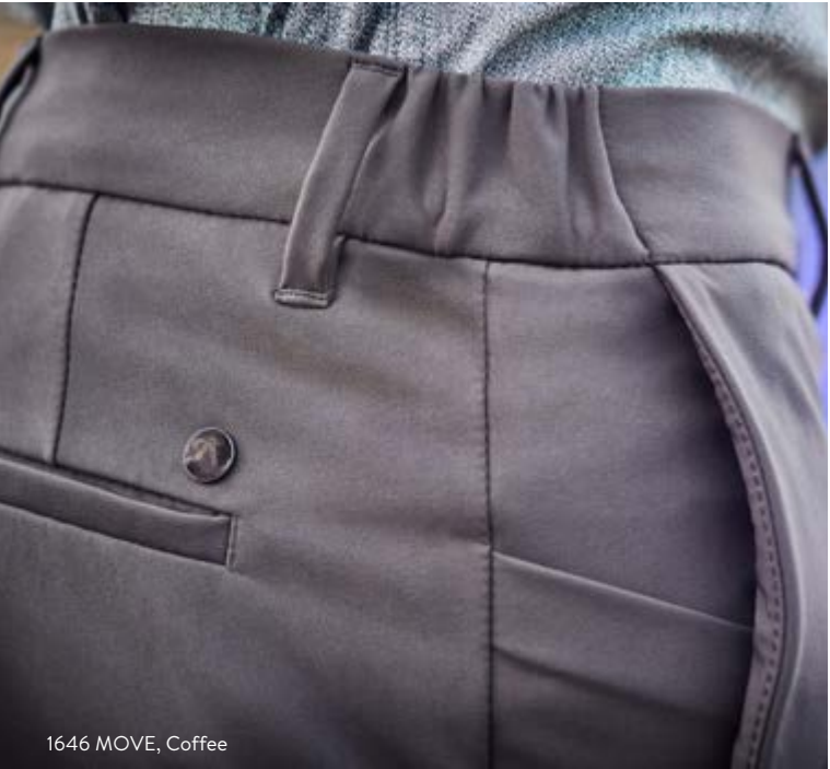
1646 MOVE, Coffee