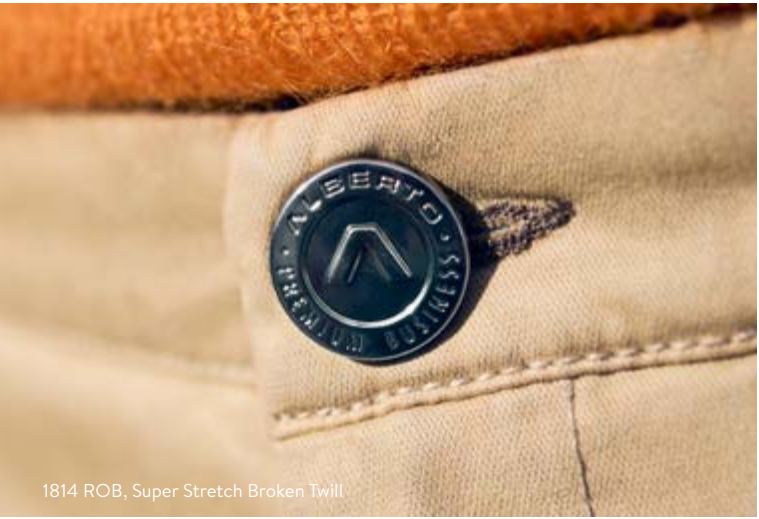
1814 ROB, Super Stretch Broken Twill